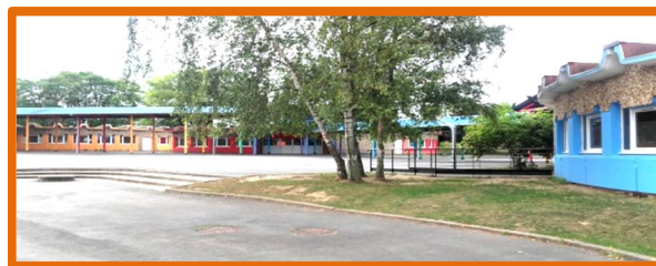
La cour de récréation

Chaque année, en septembre, les élèves de 6 ème participent à une journée d'intégration. Lors de cette rentrée, tous les élèves ont bénéficié d'une sortie au bowling avec leurs professeurs.