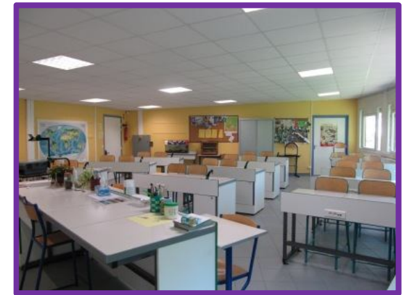
Une salle de sciences

L' étude dirigée avec une aide méthodologique est proposée pour tous les élèves, en petits groupes et encadrée par des enseignants. Une aide aux devoirs est aussi mise en place le soir de 15h à 17h.